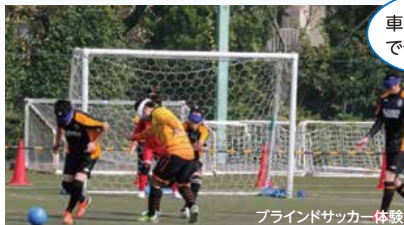
ブラインドサッカー体験