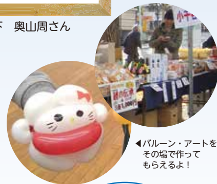
◀バルーン・アートをその場で作ってもらえるよ!

全ての人がそれぞれの人格と個性を尊重し、支え合う共生社会の実現を目指して、「ふれあいフェスタ」を開催します。